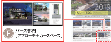
F パース部門 [アプローチ+カーベース]

■ 同時期開催中の“三協アルミ ワンダーエクステリアデザインコンテスト”のF部門からご応募頂けます