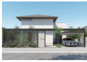
▲ U.スタイルアゼスト