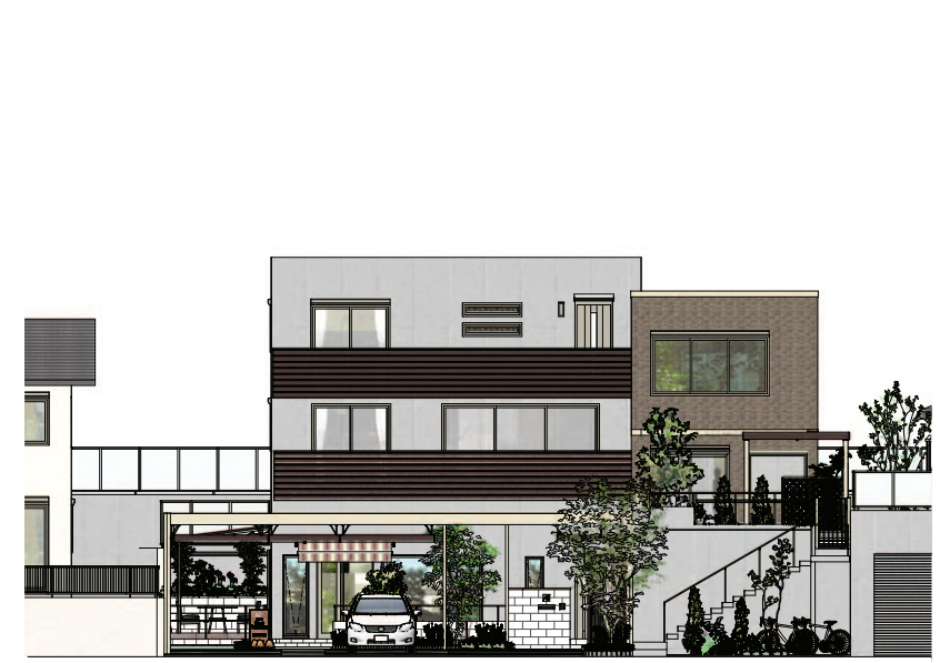
立面図 S = 1 : 150